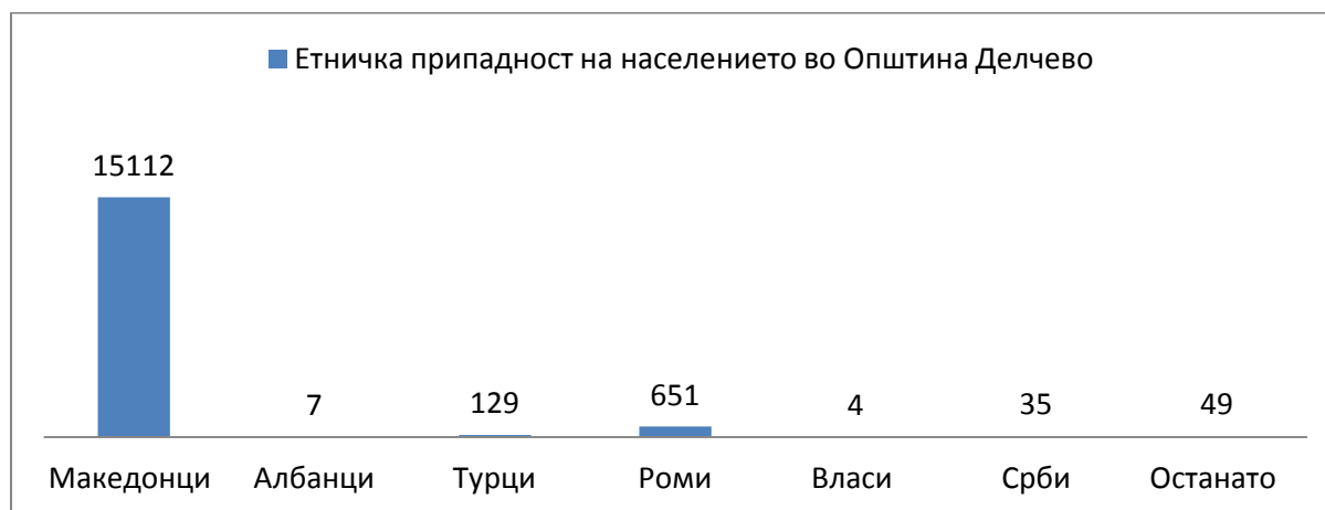
Графички приказ 2. Етничка припадност на населението во Општина Делчево, ДЗС 2019

Согласно етничка припадност на населението, Македонците се во најголем процент додека Власите во најмал. 49 лица не ја истакнале својата етничка припадност.