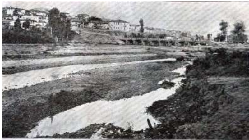
Сл.2 Царево село на почеток од 20 век