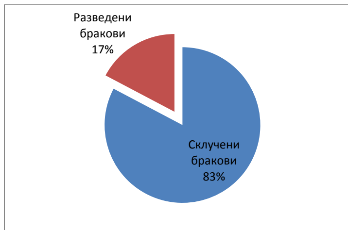
Графички приказ 3. Процент на склучени и разведени бракови (2019)