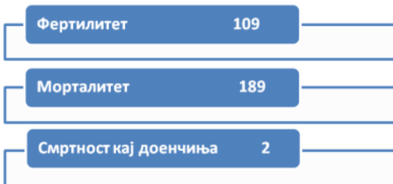
Графички приказ 4. Живородени и мртвородени деца и морталитет (2019)