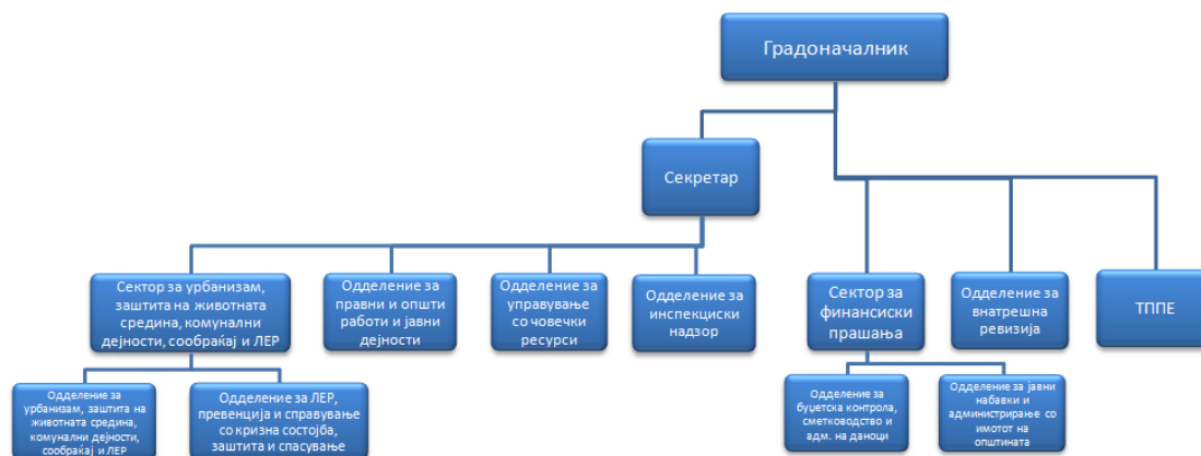
Органограм на општина Делчево

во Делчево во чест на големиот револуционер и идеолог Гоце Делчев. Брзиот стопански развој на земјата влијаеше на подемот на индустријата која го потисна занаетството и денес Делчево е модерна градска населба со широко асфалтирани улици и булевари, решена канализациона и водоводна мрежа и со паркови и зеленило.