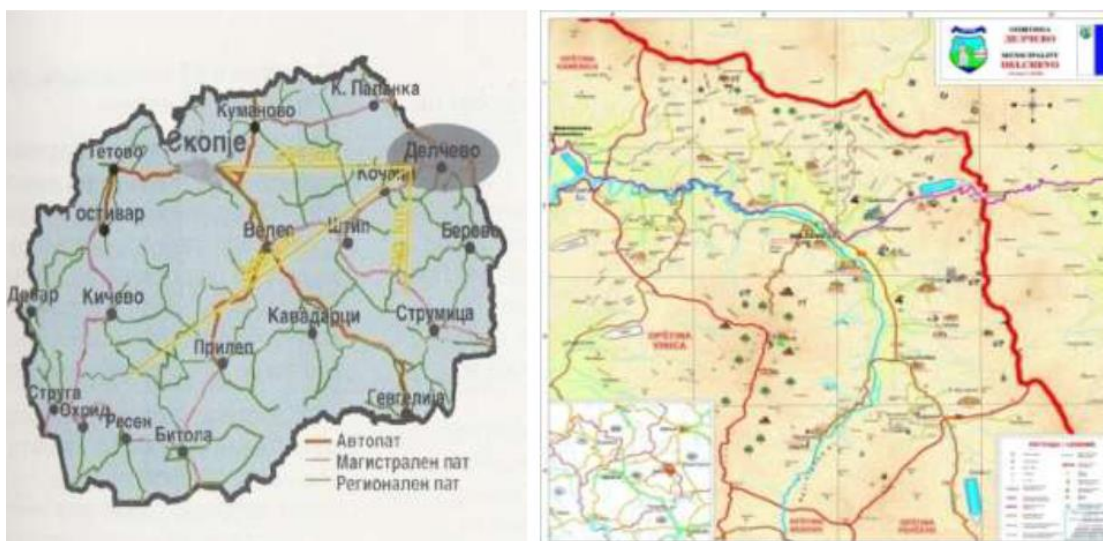
Сл.1: Делчево на мапата на Република Северна Македонија

Општина Делчево се наоѓа во крајниот североисточен дел на Република Македонија, во подножјето на планината Голак (Чавка -1524м), непосредно до бугарската граница на оддалеченост од само 10 км. На исток е заградена со планината Влаина, на север со Осоговските и на југ со Малешевските планини. Сместена е во котлината Пијанец и распослана по горниот тек на реката Брегалница.