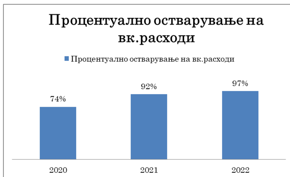
Графикон бр.1 Процентуално остварување на вкупни расходи за 2020, 2021 и 2022 година