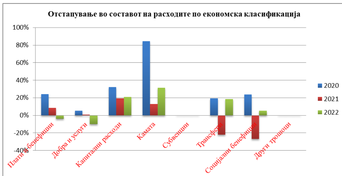
Графикон бр.3 Отстапувања во составот на расходите по економска класификација