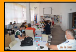
Совет на Општина Делчево: Општина Делчево ќе набавува ново противпожарно возило