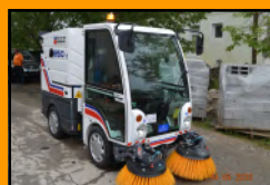
Набавено мултифункционално возило за метење на улици во ЈКП „Брегалница“